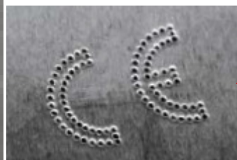
Símbolos e logotipos (opcional)