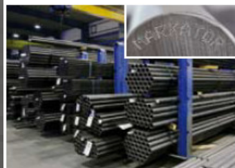
Indústria Aços e metais em geral