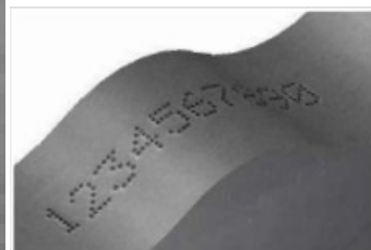
Compensação de altura até 5mm

Fazendo do FlyMarker® mini-XL uma ferramenta profissional na marcação industrial permanente em superfícies planas e curvas. Incluindo marcação de tubos axialmente ou radialmente. Indicado para marcação de VIN (marcação legal de chassis).