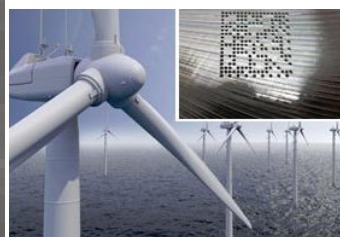
Indústria Eólica e Aeronáutica