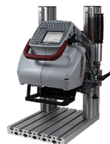
Montagem em coluna (opcional) Para funcionamento estacionário