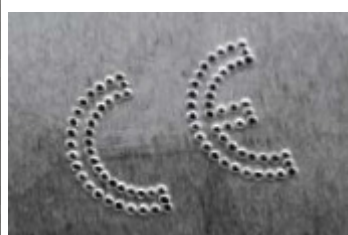
Símbolos e logotipos (opcional)