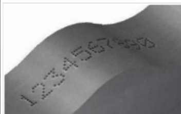
Compensação de altura até 5mm